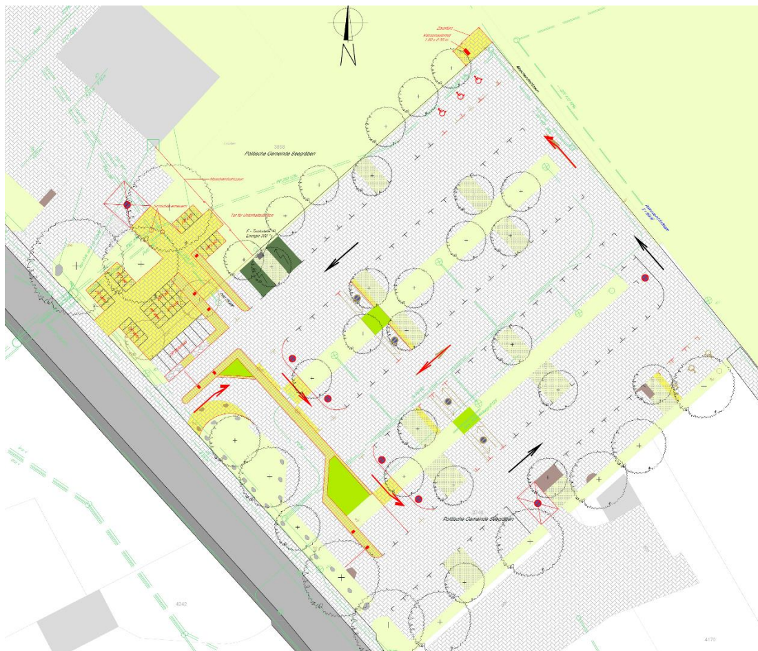
Abbildung 1: Neugestaltung Parkplatzerschliessung und Veloabstellplätze

Der Gemeinderat beauftragte die auf Verkehrserschliessung spezialisierte Marty + Partner Ingenieur AG, eine Studie für die Bewirtschaftung des Gemeindeparkplatzes mit dazugehörigem Verkehrsleitsystem zu erarbeiten.