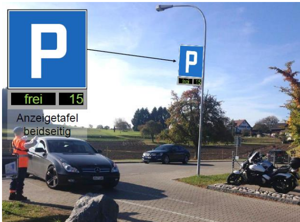
Abbildung 3: Beispiel der Anzeige beim Gemeindeparkplatz

Die Anzeige direkt beim Parkplatz hat relativ genau zu sein (Anzeige der freien Plätze), während die Anzeigen an den übrigen Standorten aufgrund der weiteren Distanz mit einer höheren Marge von „frei“ auf „besetzt“ oder umgekehrt schalten.