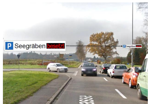
Abbildung 2: Beispiel einer Restplatz-Anzeige

Für das Leitsystem in Seegräben sollen vier Rest-Parkplatz-Anzeigen an den Abzweigungen auf die Zufahrtsachsen aufgestellt werden, die durch Anzeige "frei" respektive „besetzt“ den Verkehr gegebenenfalls auf andere Parkierungsmöglichkeiten ausserhalb von Seegräben umlenken.