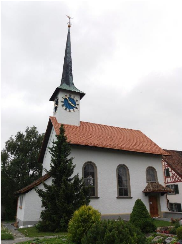
Abbildung 5: Die Kirche in neuem Kleid

Die Fassade wies insbesondere beim Turm vereinzelte Schäden auf. So blätterte der Aussenputz an einigen Stellen ab und über die Jahre hatte sich die Fassade verfärbt. Auch am Zifferblatt hatte der Zahn der Zeit genagt und eine Auffrischung war nötig.